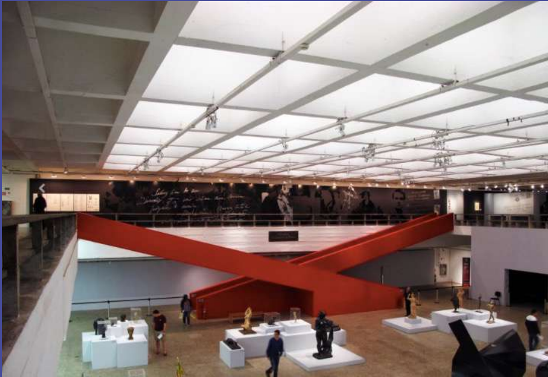
MASP Museo de Arte de Sao Paulo 1949-68