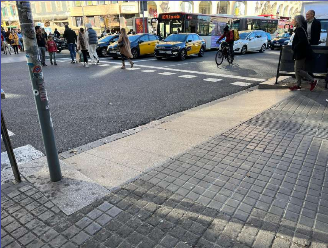
Contributo Arch. Francesco Cocco, Barcellona consulente in materia di accessibilità e Universal Design