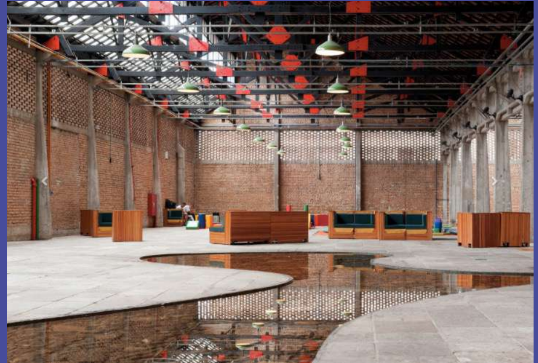
SESC POMPEIA Serviço Social do Comércio Sao Paulo 1977