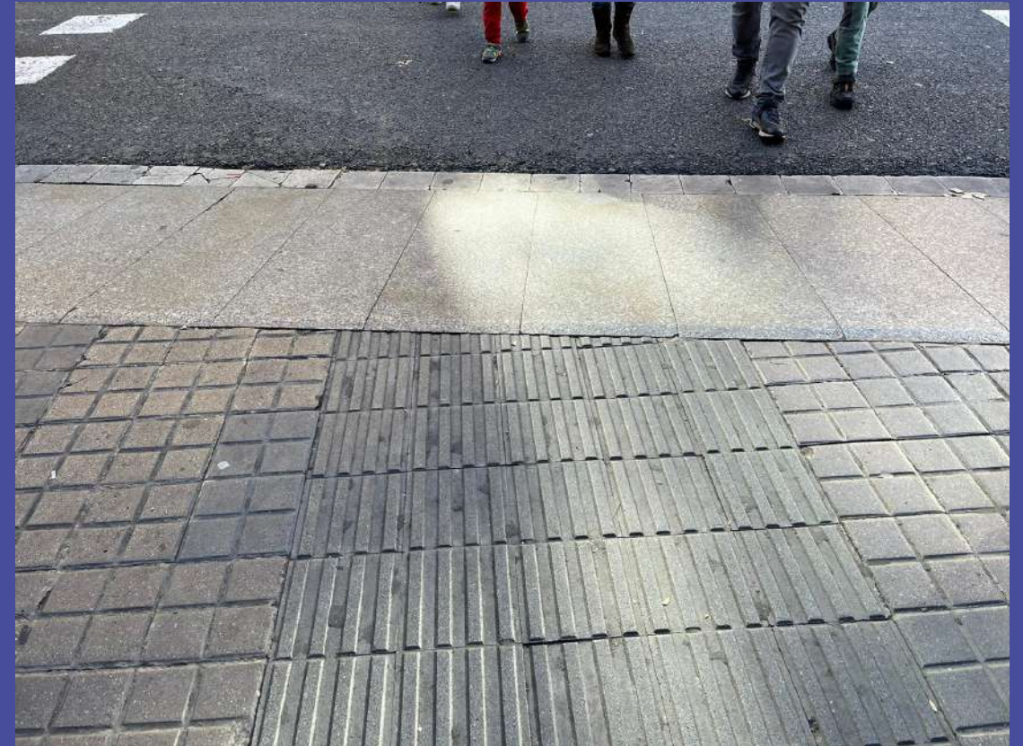
3a. eliminare la complessità non necessaria